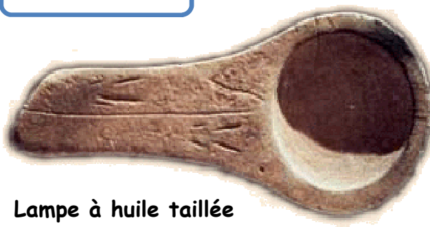
Lampe à huile taillée dans du grès