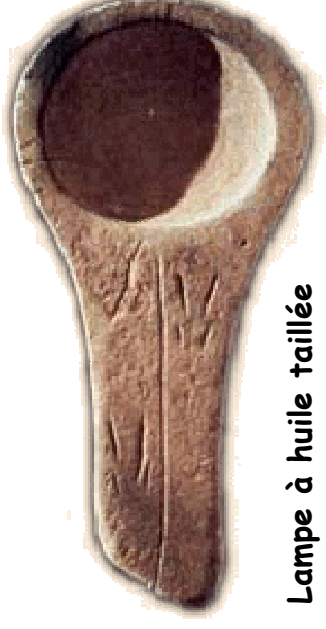
Lampe à huile taillée dans du grès