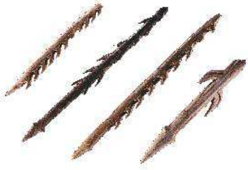
Harpons taillés dans des bois de cervidés