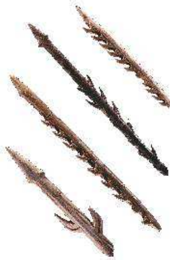
Harpons taillés dans des bois de cervidés