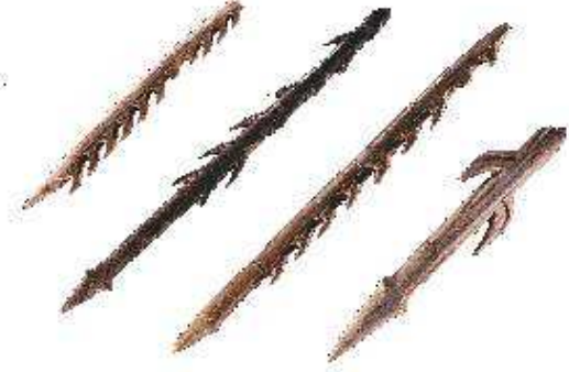
Harpons taillés dans des bois de cervidés