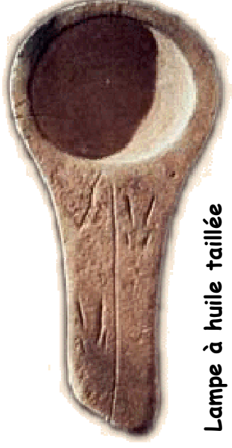
Lampe à huile taillée dans du grès