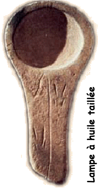
Lampe à huile taillée dans du grès