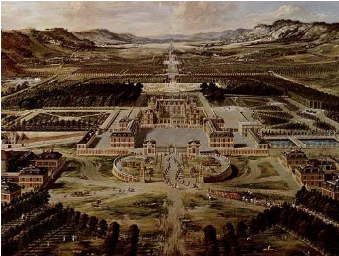
le château de Versailles