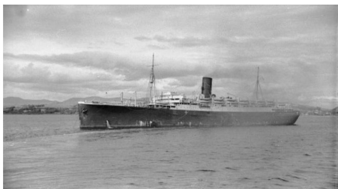
Al Lancastria, mordreizher treuzatlantel

D'ar 17 mezheven 1940, endra aloub ar Wehrmacht Bro C'hall e vor deouiat al Lancastria , ur mordreizher karget-bourr a soudarded vreizhveuriat, a vaez da Sant-Nazer. Bombezet gant nijerezed Junker alaman e tarzha hag ez a d'ar strad en ur ober 24 munutenn. 2 500 den bev zo adkavet. Dre ma n'eus ket bet enrollet an dreizhidi deuet war dec'h, ne c'heller ken brasjediñ an niver a dud marvet war-dro 5 200.