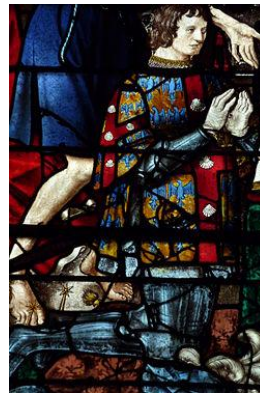
Gwion XVI a Laval

Galvet eo Gwion XVI a Laval da zont da zifenn kêr. Diwar an darvoud-se an hini ez eus divizet sevel Kastell an Tarv e ouf Montroulez.