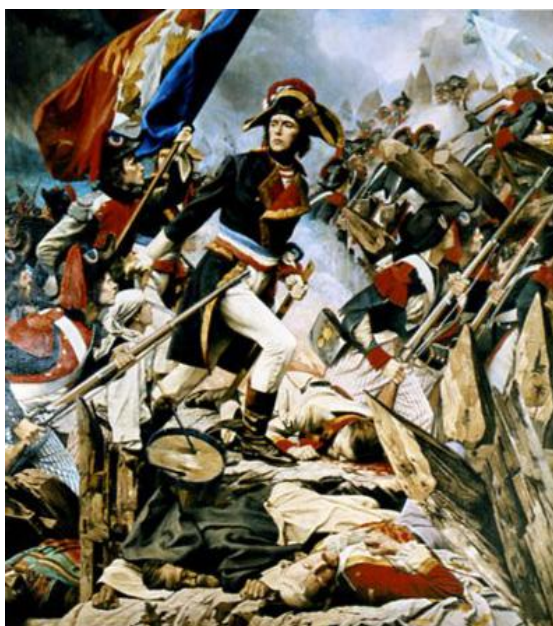
Louis-Lazare Hoche e Emgann Kiberen, livadenn gant Charles Porion, XIXvet kd.

Endra glask ar Vodadenn Vroadel skañvaat pouez ar roueelourion e tilestr an enepdispac'h eus Breizh-Veur e Breizh. Goude m'eo saoz al lifreoù, ez eo an darn vrasañ eus ar soudarded divroidi, deuet eus Breizh hag eus Toulon (roueelourion met republikaned bet krabanet ivez), evit adsevel an unpenniezh. Goude bezañ deuet a-benn da zilestrañ gant 3500 den, well-wazh, e sav an dizurzh e-mesk levierion « an Divroidi ». Argaset ha trec'het e vefont d'an 21 gouere gant ar jeneral Hoche.