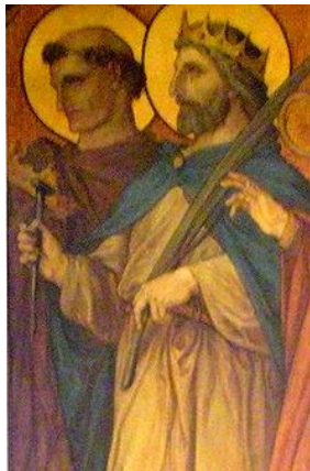
Salaün III, roue Breizh, gt Alfoñs an Henañ, XIX vet kd.

(Ha c'hoazh : e 872 ez aloub Hasteinn Angers. Seziz zo graet gant ar Franked d'o zrec'hiñ. Emgavout a ra Salaün a zo trec'h war Franked Karl ar Moal, met a zistro ar Stêr Maine evit lakaat drakaroù an Normaned war ar sec'h ha Hasteinn da godianañ).