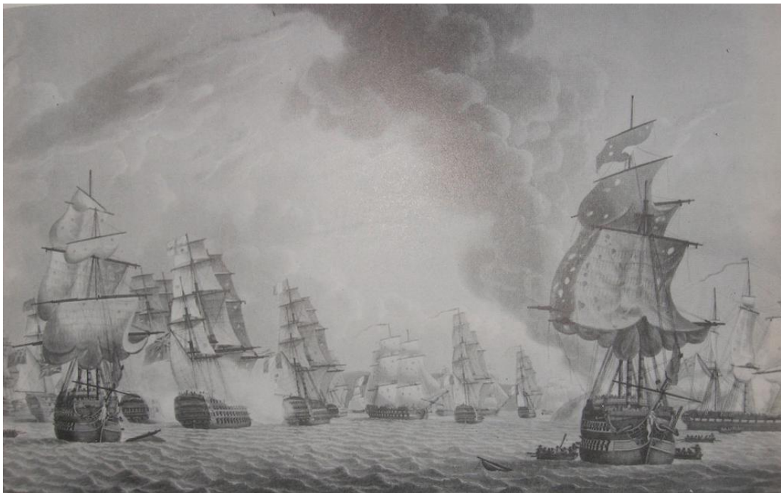
Emgann Groe, 1795

E Emgann Groe emañ Bro-C'hall enep da Vreizh-Veur. D'an 8 mezheven 1795 e oa bet taget un aridennad bigi gall gant al lu saoz a bak 7 lestr. D'ar 15 mezheven e teu listri all da reiñ harp d'al lestraz c'hall da zerc'hel penn ouzh Breizhveuriz. Goude un nebeud redadegoù poursuiñ e krog an emgann da vat d'an 23 mezheven, 5 miz ar mediñ, bloaz III. Trec'h eo Breizh-Veur. 670 den zo aet da anaon e-mesk ar C'hallaoued, 31 e-touesk Breizhveuriz. Kabitened c'hall zo a zo bet dic'haloñset peogwir n'o doa ket sentet da urzhioù ar besamiral Villaret de Joyeuse.