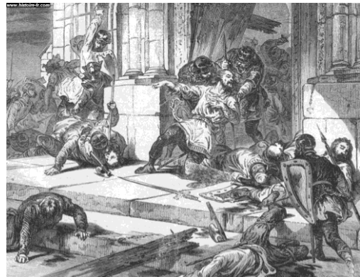
Marv Roperzh ar C'hreñv , gant Paul Lehugeur, XIX vet kd.