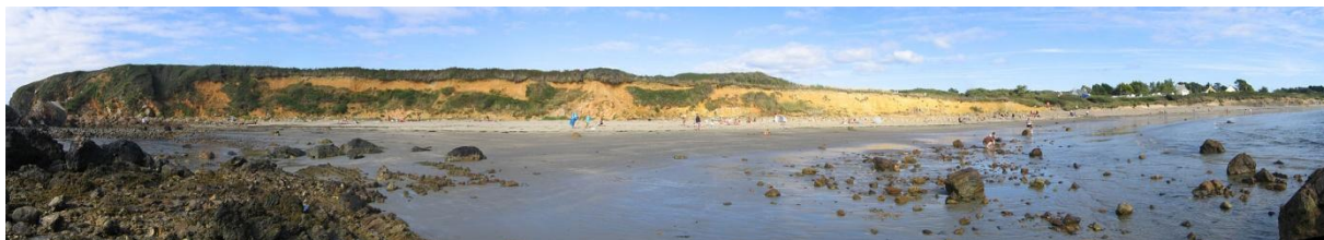
An Traezh Rouz, ma tilestras ar bagadoù breizhveuriat-izelvroat

Klask a ra an argaderion argilañ nemet e verzhont en deus lezet ar mor, o trec'hiñ, o bagoùigoù war ar sec'h. Taget eo an argaderion gant ar Vrezhoned d'o zro. Un drailh zo graet anezho. Ouzhpenn mil soudard ha moraer breizhveuriat pe izelvroat zo faezhet. Ha morse ne vo taget Brest dre vor ken.