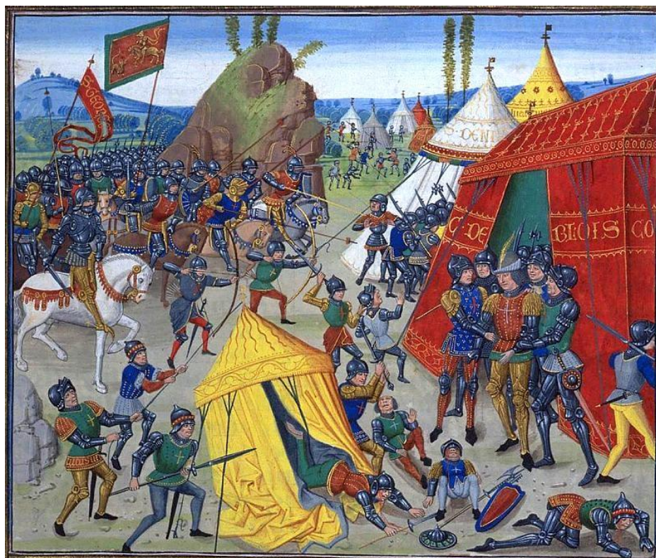
Charles de Blois, harpet gant bagadoù Thomas Dagworth er Roc'h-Derrien d'an 20 mezheven 1347

[E eost 1347 e voe argaset ar Saozon eus ar Roc'h-Derrien gant tud an tolead o c'hasae hag ur bagad Gallaoued hag ur c'horf-arme jenoat bet kaset gant Philippe de Valois.]