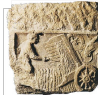
Moissonneuse, II ème s. av. J.-C.

Les artisans gaulois sont nombreux. Les plus réputés sont les forgerons : ils sont habiles dans le travail du fer et du bronze.