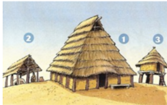
(1) Hutte (2) Atelier (3) Grenier

habiles qui utilisent des outils performants ( soc à charrue, hache, pioche, faucille, faux ) et du matériel perfectionné (comme la charrue ou la moissonneuse ).