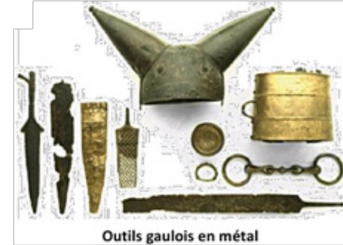
Outils gaulois en métal