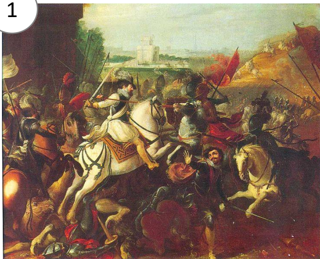
Henri IV (Henri 4) à la bataille d'Arques, septembre 1589.

Peinture sur bois du XVI ème (16 ème ) siècle