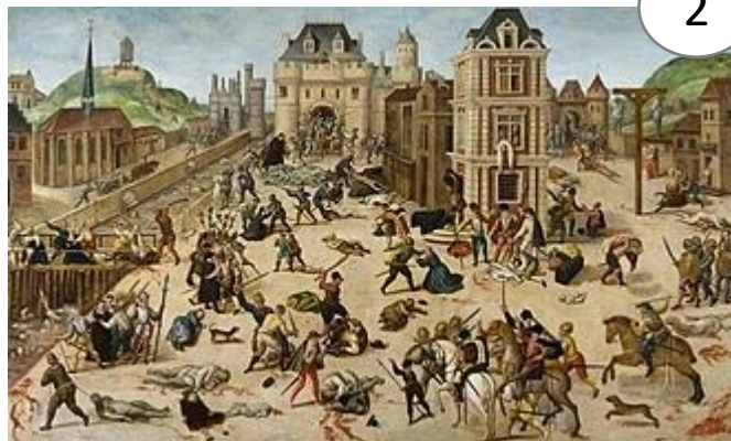
Le massacre de la Saint-Barthélemy, par François Dubois, 1582

Depuis 1562, les guerres de Religion opposent les catholiques aux protestants qui veulent réformer l'Église et son organisation. Ces guerres sont marquées par des violences et des massacres meurtriers de part et d'autre. Le massacre de la Saint-Barthélemy est un point culminant dans cette guerre. Ce jour-là, à Paris, les catholiques massacrèrent près de 3 000 protestants. Ces guerres civiles religieuses dureront jusqu'en 1598.