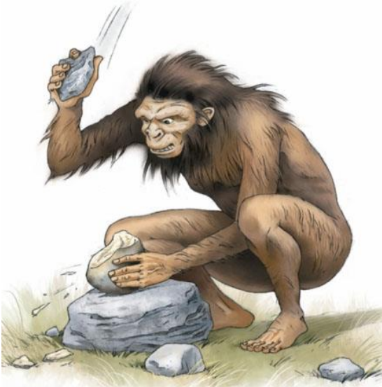
L'homo habilis, il y a 2,5 millions d'années