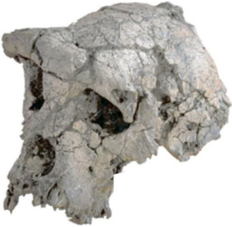
Crâne de Toumaï, il y a 7 millions d'années