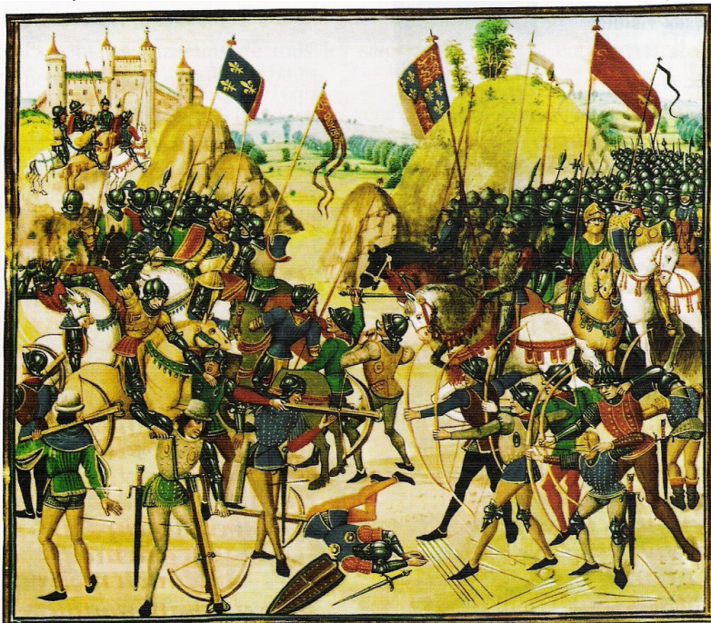
▲ Doc. 1 : La bataille de Crécy en 1346, enluminure du xv e siècle.

La guerre commence mal pour les Français : ils sont battus à Crécy en 1346 .