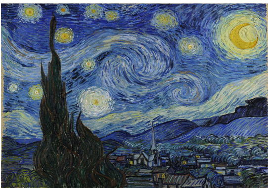
La nuit étoilée (1889)

Dans ses peintures, Van Gogh utilise des couleurs différentes des couleurs réelles. Souvent, il traduit les choses qu'il observe en exagérant les formes (exemples : nuages en forme de tourbillons, montagnes arrondies, arbres tordus, ...). Il utilise aussi des petits traits de peinture pour donner le mouvement.