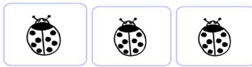
trois coccinelles rouges