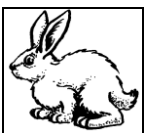
un petit lapin marron