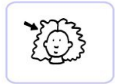
une gentille fille blonde

✓ Un _____ est un mot qui donne des précisions sur le _____.