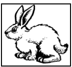
un petit lapin marron