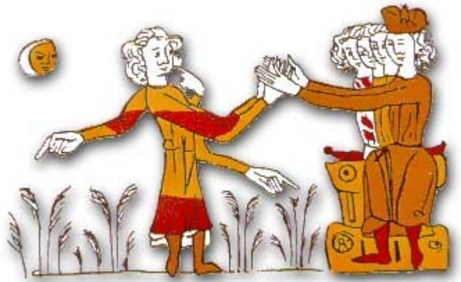
miniature anonyme du XIV ème siècle

Le seigneur, assis et entouré de sa cour, ferme ses mains sur celles de son vassal. Celui-ci est muni de trois autres mains ; de l'une il se désigne lui-même et des deux autres, il indique le fief (représenté par les épis) pour lequel il fait hommage.