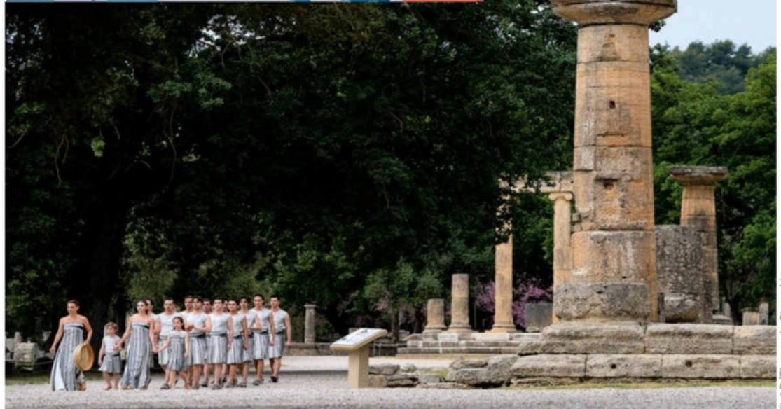
La cérémonie a eu lieu devant le temple d'Héra, construit vers 590 av. J.-C.. Dans les légendes grecques, Héra est la femme de Zeus (le « chef » des dieux de l'Olympe).

Athènes-Marseille : environ 1 800 km par la mer, soit 12 jours de voilier