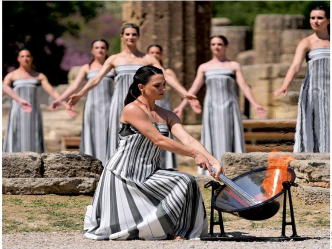
Une comédienne allumait la flamme olympique, lundi, lors d'une répétition. Comme le veut la tradition, la torche a été enflammée grâce à un miroir concave (en creux) et aux rayons du Soleil. Mardi, la torche a été allumée avec le feu de la répétition (voir photo de Une), car il y avait beaucoup de nuages.