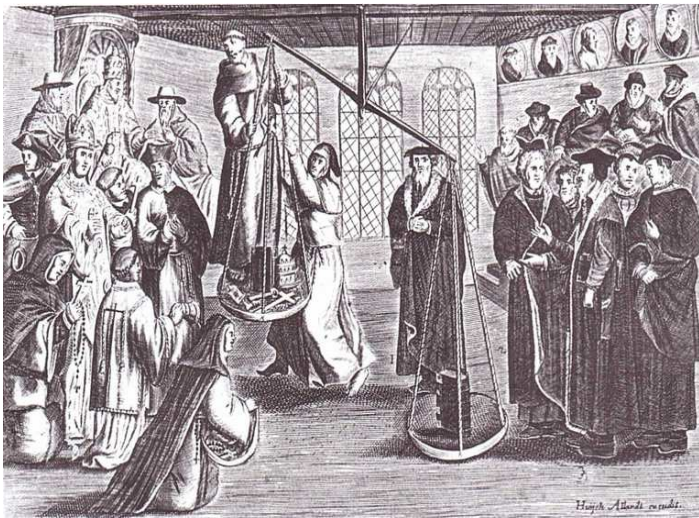
La Réforme protestante vue par les protestants