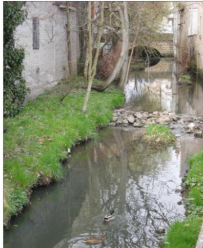
La rivière Nièvre passant à Nevers.

Le département de la Nièvre est situé dans la région Bourgogne-Franche-Comté, dans le CENTRE du pays.