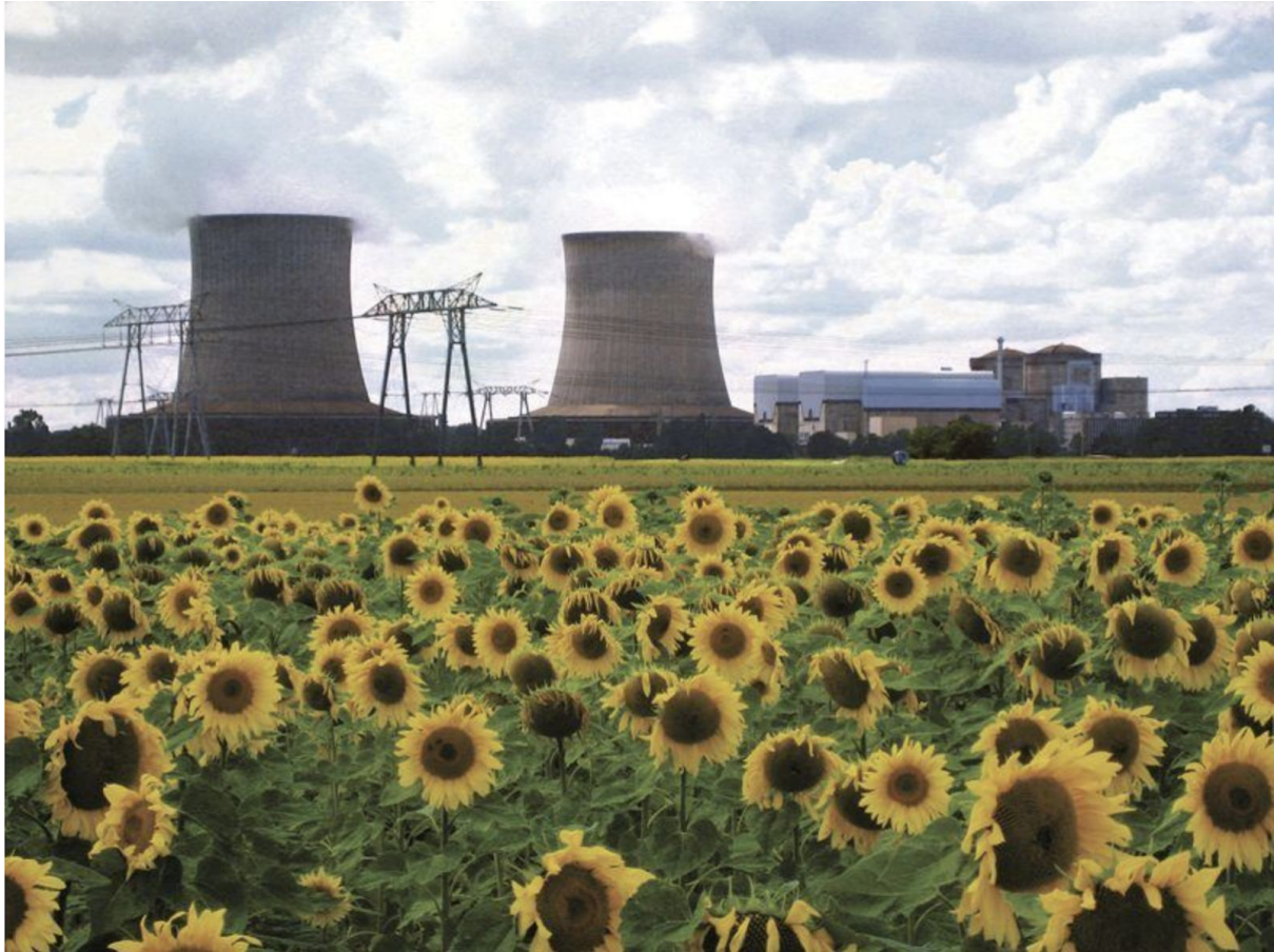
Centrale Nucléaire de Saint-Laurent-des-Eaux, 2007.