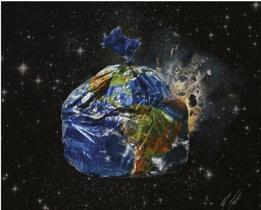
Gideon Wright, Trashed Earth, 2010.

Question 1 : Que représente cette image ?