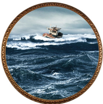
Fuite et Rejet