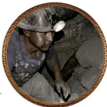
Exploitation des Personnes et de l'Environnement