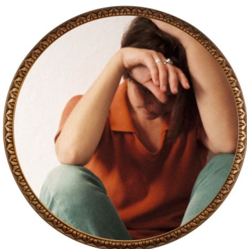
Trafic des Etres Humains