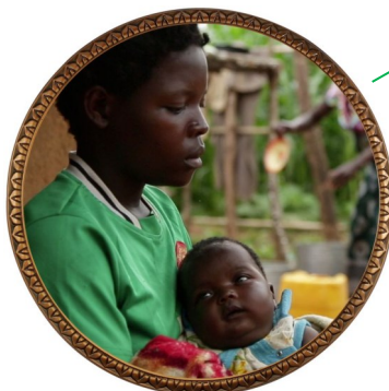
Mariage Précoce Forcé