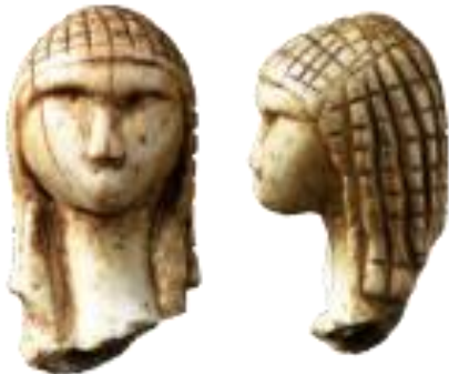
Vénus de Brassempouy, en ivoire, vieille de 23 000 ans (Landes)