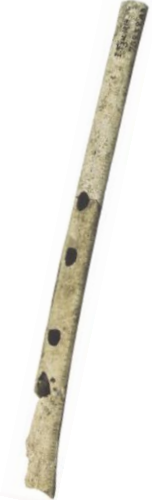
Flûte en os, vieille de 20 000 à 30 000 ans, Isturitz (Pyrénées-Atlantiques)

Dans les grottes, qui étaient sombres, les artistes de la préhistoire s'éclairaient avec des lampes alimentées en graisse de renne.