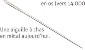
Une aiguille à chas en métal aujourd'hui.