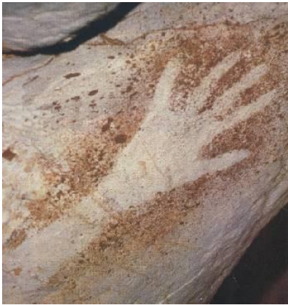
Main peinte, vieille de 27 000 ans, Grotte Cosquer (Marseille)