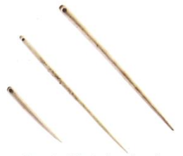
Des aiguilles à chas (trou) en os (vers 14 000 avant J.-C.).

Homo sapiens utilisait des aiguilles pour coudre ses vêtements en peau.