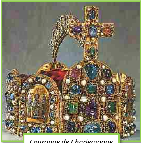
Couronne de Charlemagne

Amuse-toi à reproduire ce morceau de la couronne de Charlemagne sur le quadrillage.