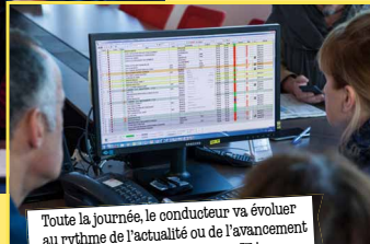
Toute la journée, le conducteur va évoluer au rythme de l'actualité ou de l'avancement des sujets. Et même pendant le JT !