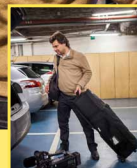
Les JRI déposent leurs images au service technique. Elles peuvent aussi être envoyées par Internet ou par liaison satellite.