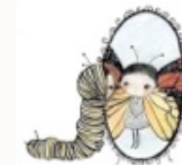
Tu es unique.