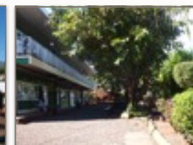
Le bâtiment B CE2 - CM1 - CM2