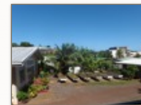
L'espace potager de l'école.

Dans le cadre du dispositif des CP/CE1 allégés, l'école a accueilli cette année une enseignante supplémentaire au CP et accueillera l'année prochaine deux autres enseignantes.