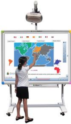
Un tableau numérique.