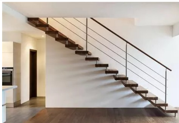
je veux descendre