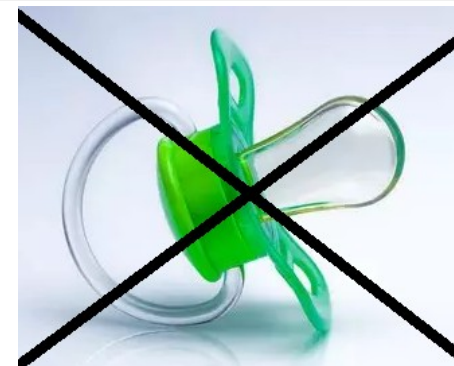
je ne veux plus ma sucette