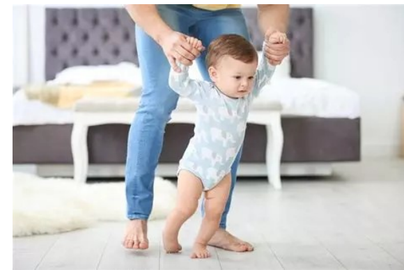
je veux qu'on me fasse marcher