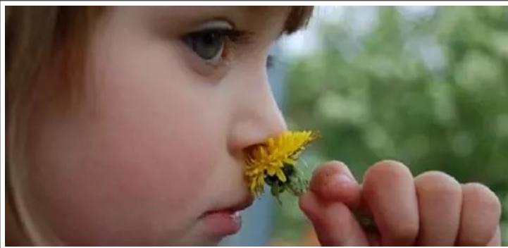
ça sent bon