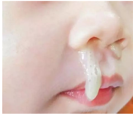
je veux qu'on me mouche