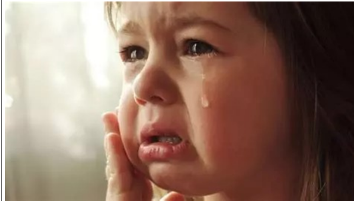
j'ai envie de pleurer,