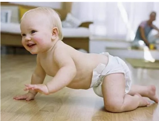
je veux marcher à 4 pattes