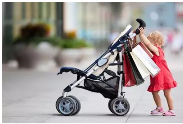
je veux aller me promener