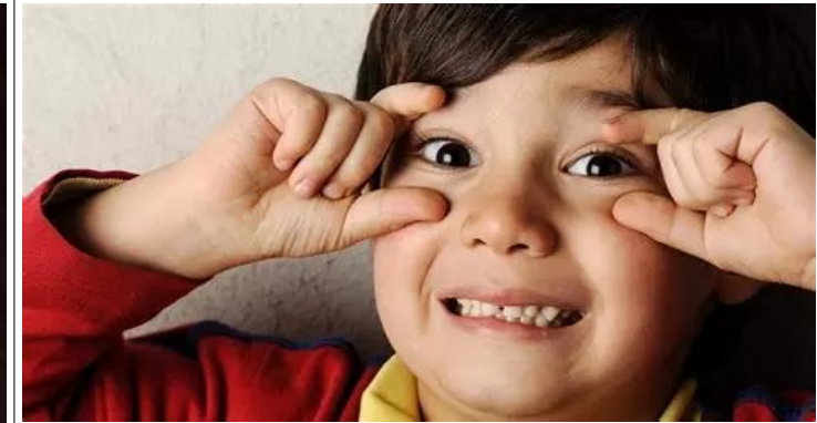
je veux voir