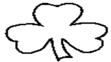
Le trèfle irlandais