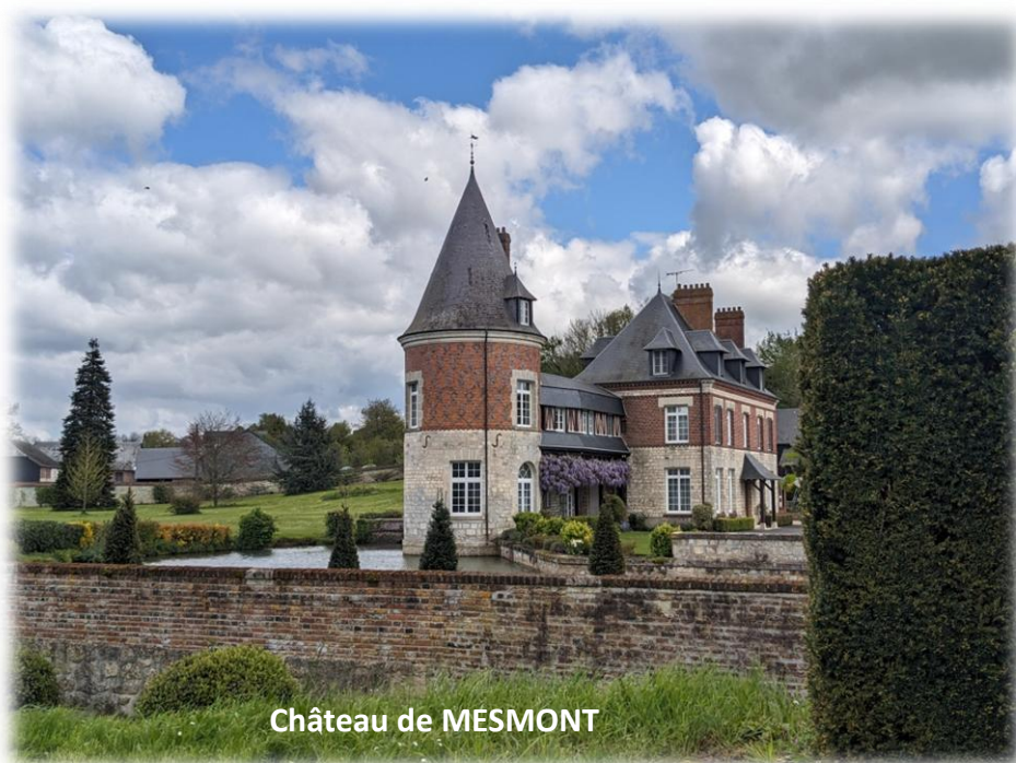
Château de MESMONT