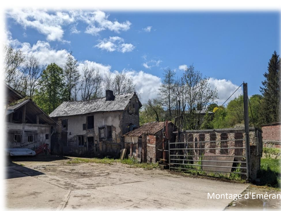
Montage d'Emérancé Bétis - 21 avril 2024