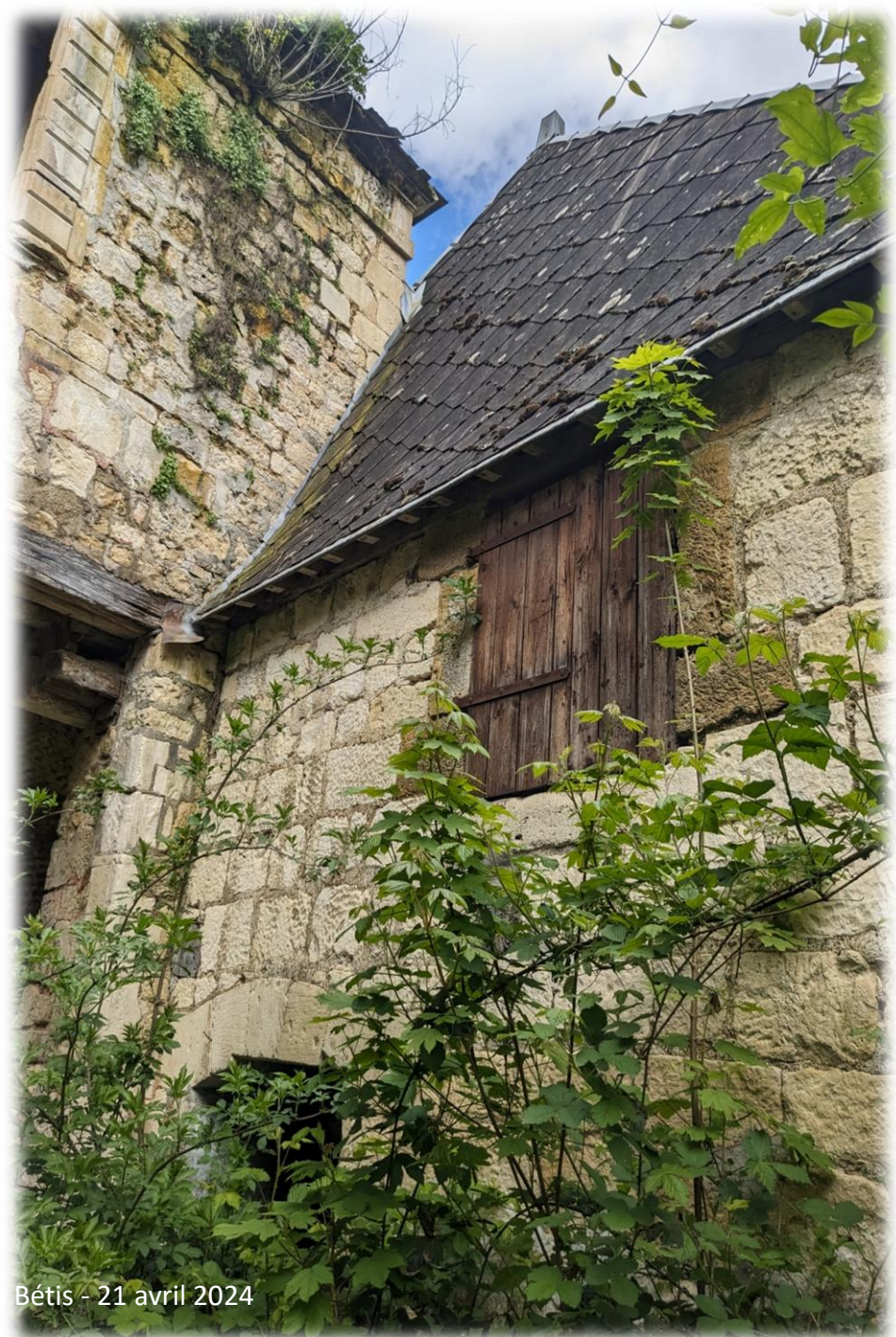
Montage d'Eméranc Bétis - 21 avril 2024