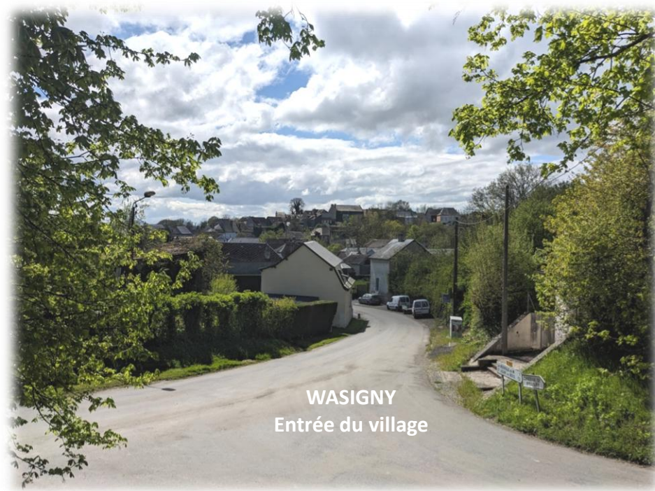
WASIGNY Entrée du village