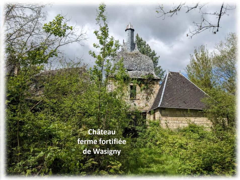
Château ferme fortifiée de Wasigny