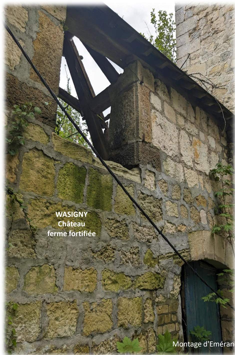
WASIGNY Château ferme fortifiée