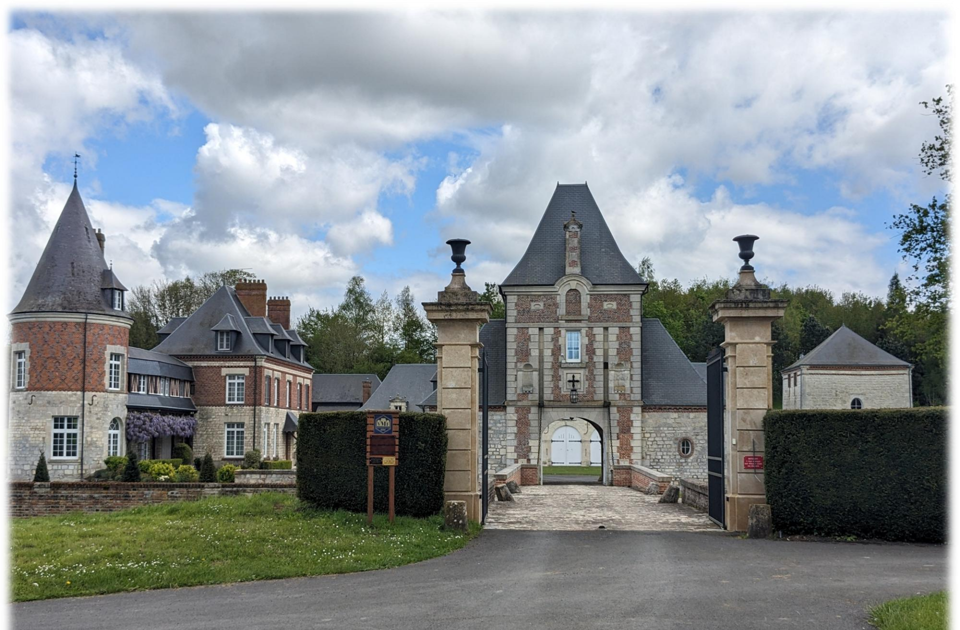
Château de MESMONT

Montage d'Emérance Bétis - 21 avril 2024