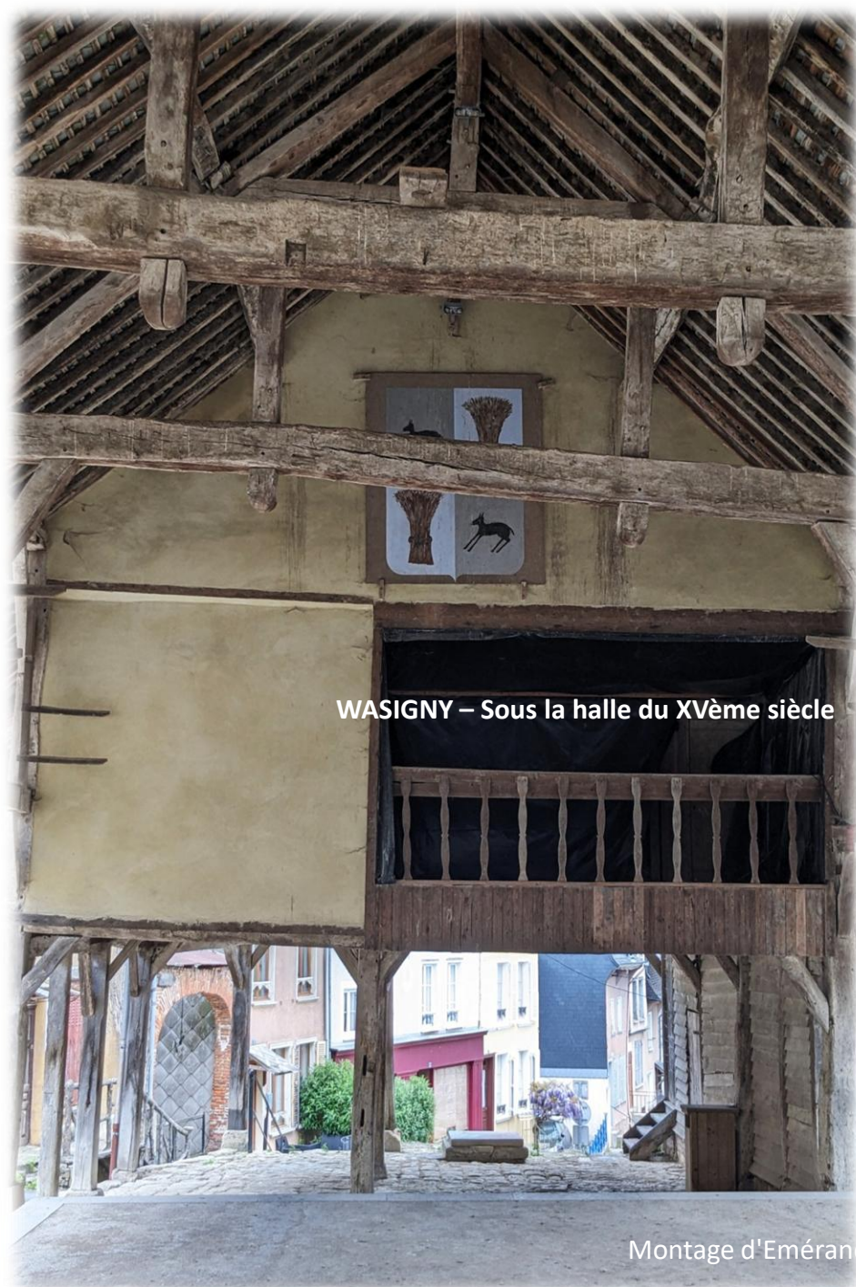
WASIGNY – Sous la halle du XVème siècle