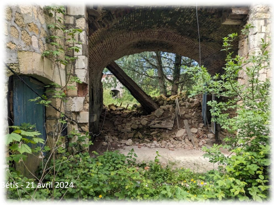
Montage d'Emerance Bétis - 21 avril 2024