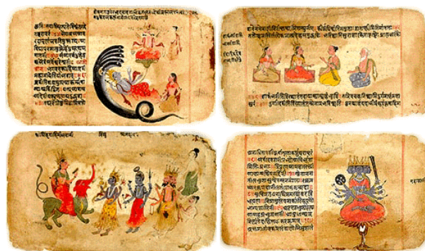
Fragments des textes védiques

L'Ayurveda a ses origines dans ces documents, qui représentent en même temps la fondation du système du Yoga; les Vedas (en sanskrit « Véda », se traduit comme « connaissance ») représentent un grand regroupement de textes originaires de l'Inde ancienne, les plus anciennes formes de la littérature sanskrite et les plus anciens textes sacrés de l'hindouisme. Les Vedas sont peut-être les plus vieux textes écrits sur notre planète aujourd'hui. Ils remontent au début de la civilisation indienne et sont les premiers documents littéraires témoignant de la race aryenne. Ils ont été transmis apparemment par la tradition orale pendant plus de 100 000 ans. Leur forme écrite est apparue seulement il y a 4 000 – 6 000 années.