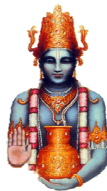
Le dieu de la médecine ayurvédique, Dhanvantari

Parmi les sages qui ont contribué au développement et à la transmission de cette connaissance pour le bien-être de l'humanité, est le grand sage et voyant Dhanvantari (1500 av. J.-C.). Une des plus importantes figures de l'Ayurvéda, il est considéré le saint ou la déité de cette discipline, ayant le rôle de protecteur de l'apprentissage et de la pratique de l'Ayurvéda. Traditionnellement, les traitements ayurvédiques commencent par la récitation des mantras dédiés à Dhanvantari, l'avatar de Vishnu et le Dieu de la médecine et de la connaissance Ayurvédique.