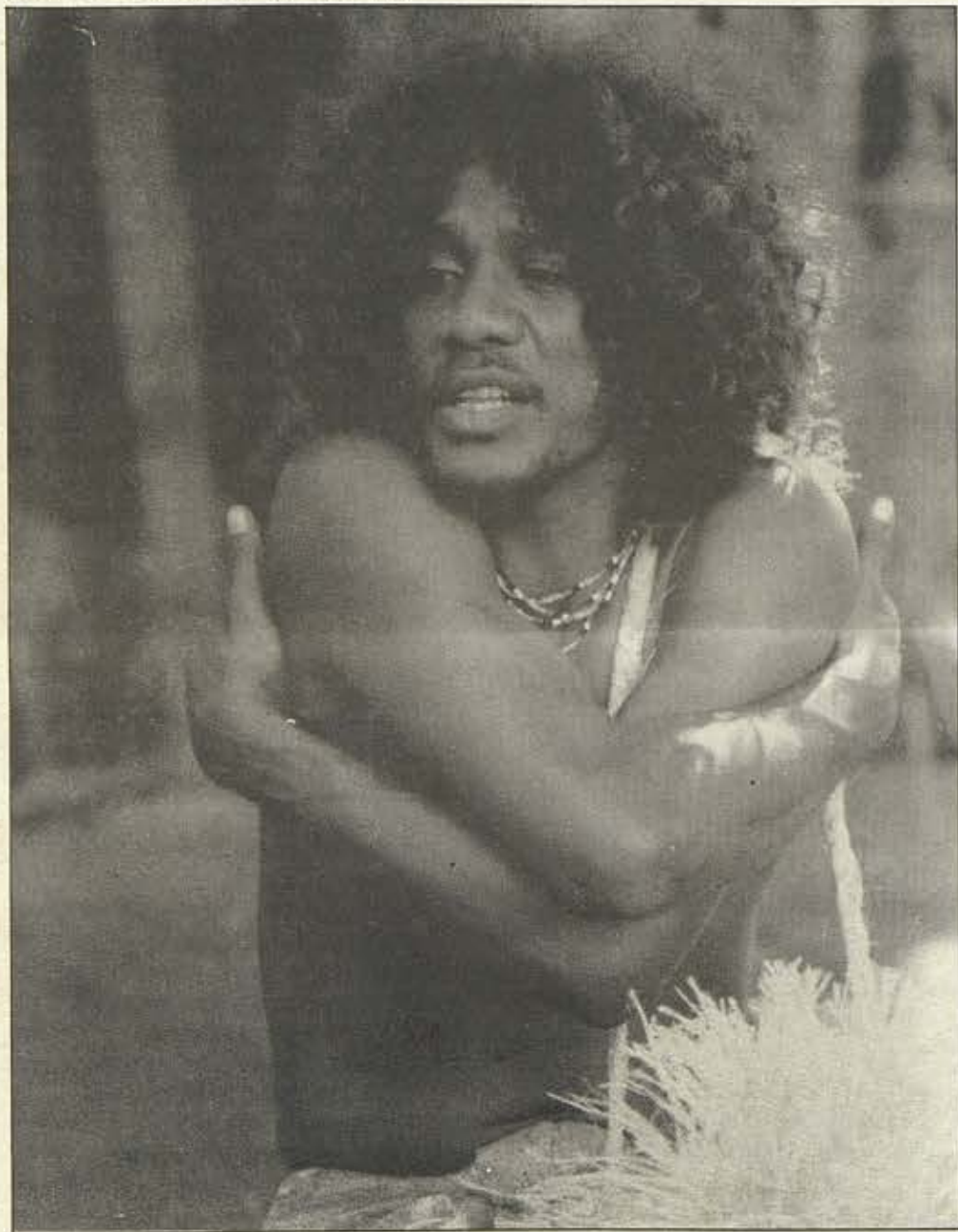
Jeune Mélanésien .

O vai ma teie mau tamarii e imi nei i te ohipa. Teie a mau tamarii ta te fare haapiiraa i rual mai i rapae e teie e ihu noa nei i te taa ore e na hea ratou i to ratou oraraa e to ratou puai. E te mau tamarii i haere i te mau haapiiraa teitei, ia hoi mai ratou, eere i ta ratou mau parau e noaa ai ta ratou ohipa. Mea maere, eiaha ra e maere. Te mea e iteahia nei teie ia : ia piri fei e noaa te ohipa, ia faaea rio noâ, aore ra ia faaea hamoa noa, e piri te ûputa o te mau pu ohiparaa.