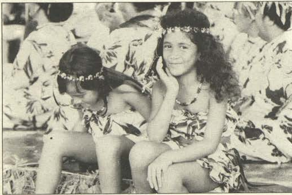
2 jeunes Polynésiens.

nua, e hooraa ihoa to muri iho. E aha te mea e hotu mai, eere te maa, e papaâ ra e te tinito.