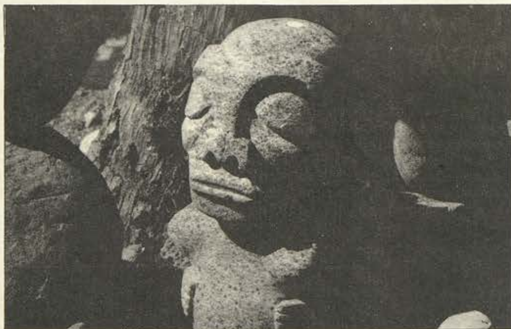
Guerre des dieux d'ici et d'ailleurs.

Tant que l'Administration française dirigeait le Territoire, il existait une complicité objective, fût-elle ethnique, entre le monde politique local (dont certains partis réclamaient depuis longtemps l'autonomie politique) et l'Eglise évangélique (qui bénéficiait d'une autonomie ecclésiastique depuis 1963), complicité qui masquait bien les divergences.