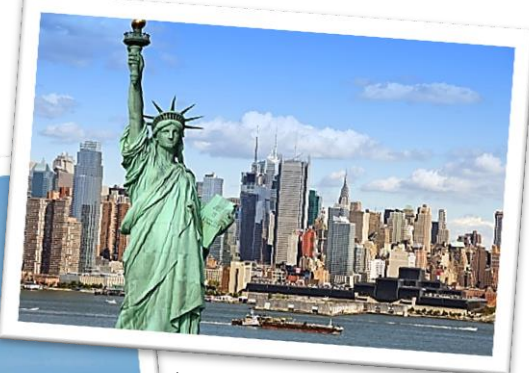
La statue de la liberté

La capitale des États-Unis est Washington. New York est la plus grande ville des États-Unis, on la surnomme la grosse pomme.