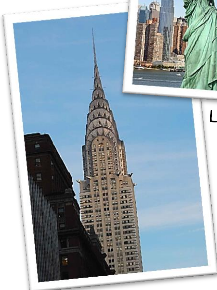
Le Chrysler Building