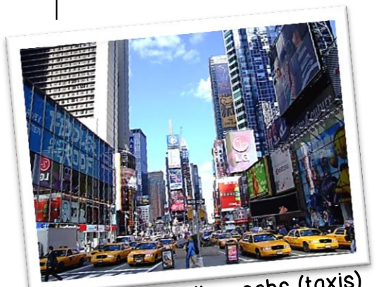
Avenue et yellow cabs (taxis)