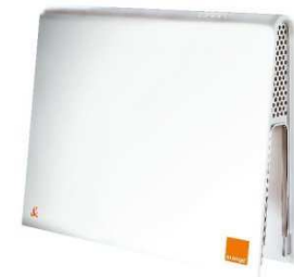
9- Un modem