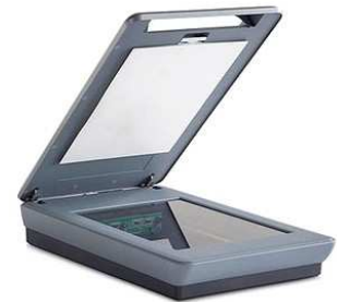
6- Un scanner