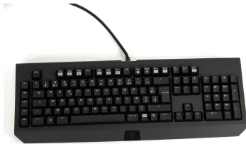
4- Un clavier