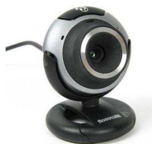
11- Une webcam