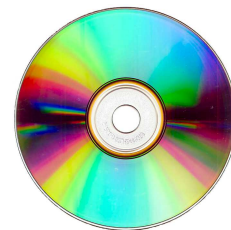
12- Un CD-Rom