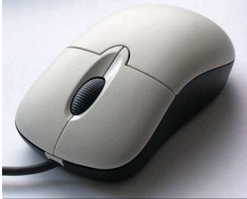
1- Une souris

Nomme les différents éléments d'un ordinateur