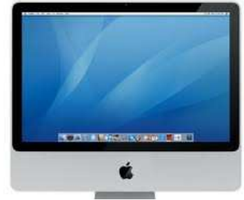
3- Un moniteur