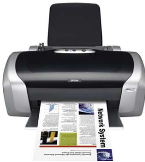
7- Une imprimante