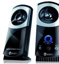
8- Des enceintes