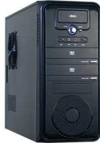
2- Une unité centrale