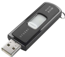
10- Une clé USB