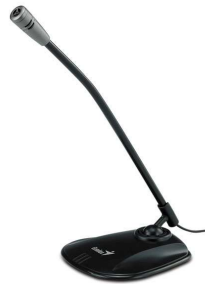
5- Un micro