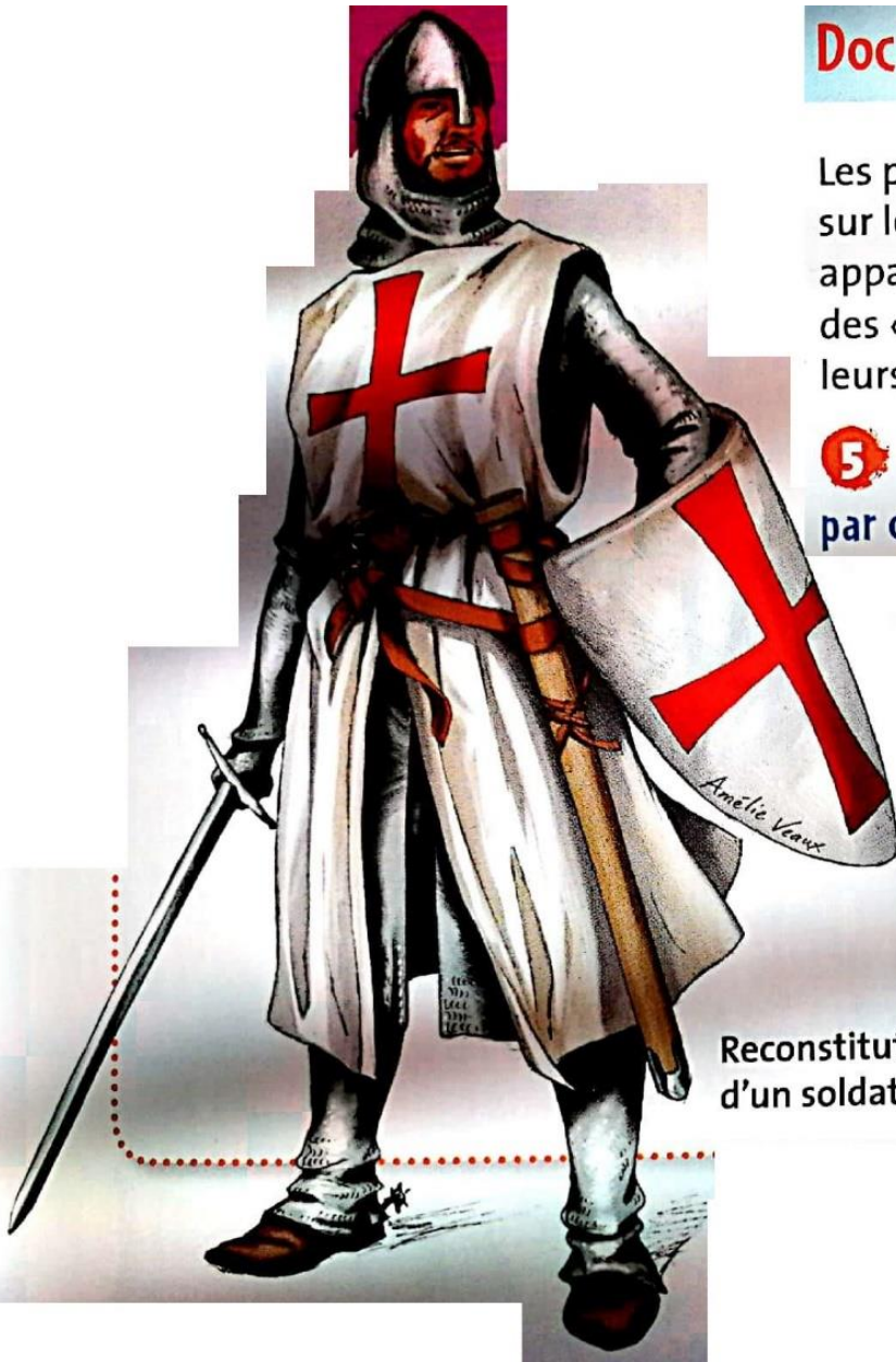
Reconstitution d'un soldat croisé

5 Quel est le signe distinctif porté par ce soldat ?