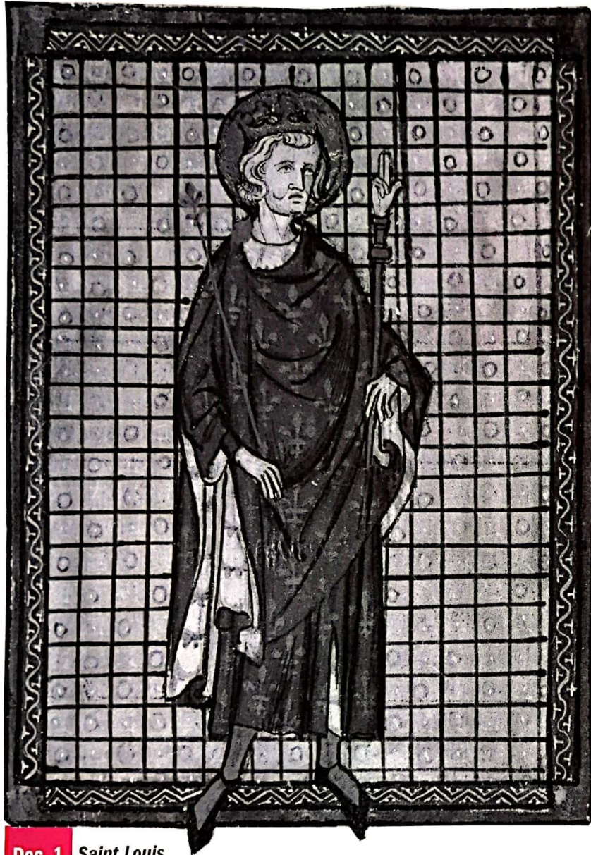
Doc. 1 Saint Louis , roi de 1226 à 1270, miniature, fin XIII e siècle.