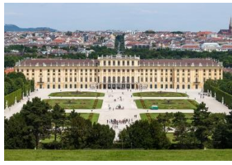
Das Schloss Schönbrunn