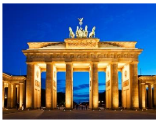
Das Brandenburger Tor