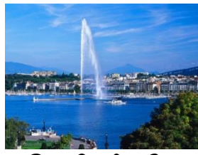
Das Genfer See