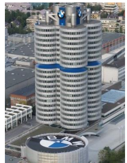
Das BMW Museum