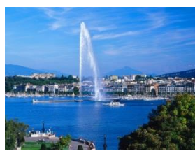
Das Genfer See