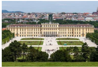
Das Schloss Schönbrunn