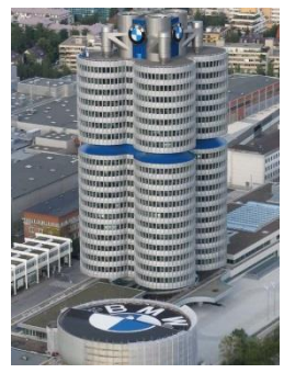
Das BMW Museum