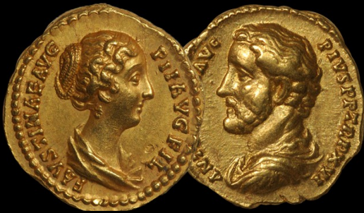
Monnaies de l'Antiquité

Il y a trois âges principaux sous l'Antiquité : l'âge du cuivre, l'âge du bronze et l'âge du fer.