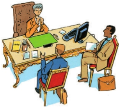
1. Les députés, les sénateurs ou le gouvernement proposent une loi.