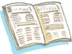
3. Si la loi est votée, elle est publiée au Journal officiel.