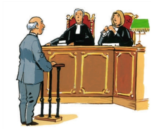
5. Les juges sanctionnent ceux qui ne respectent pas la loi.