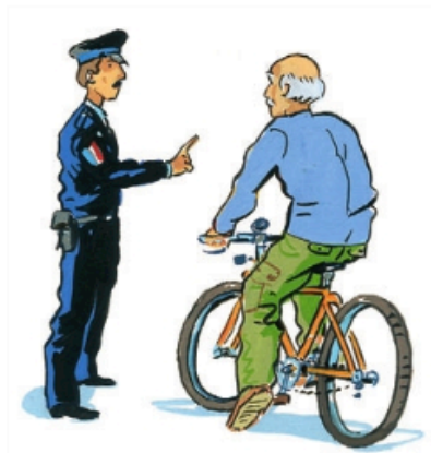
4. Le gouvernement fait appliquer la loi.