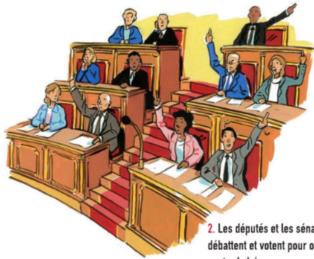
2. Les députés et les sénateurs débattent et votent pour ou contre la loi.