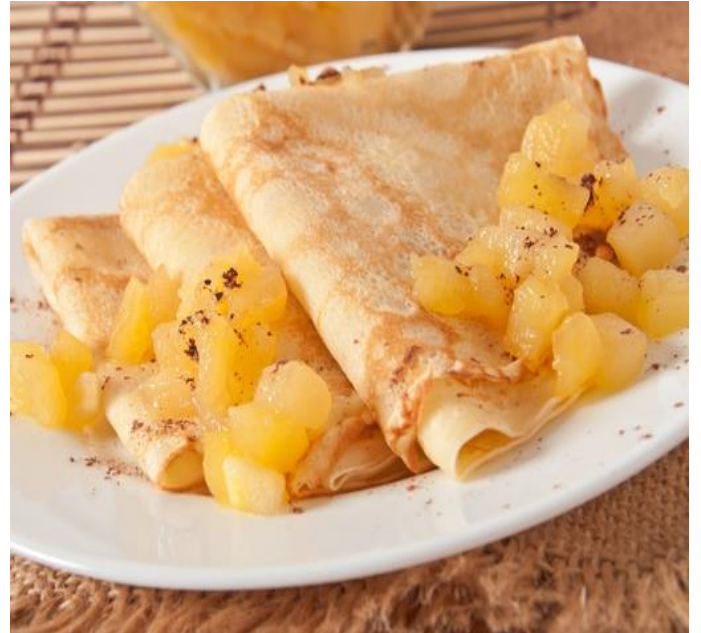
12 Crêpe normande