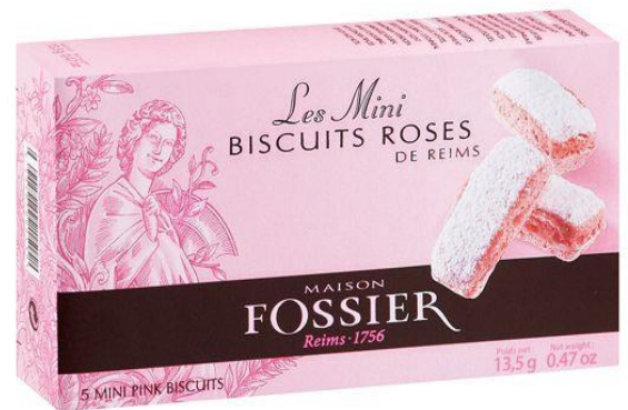
8 biscuits roses de Reims