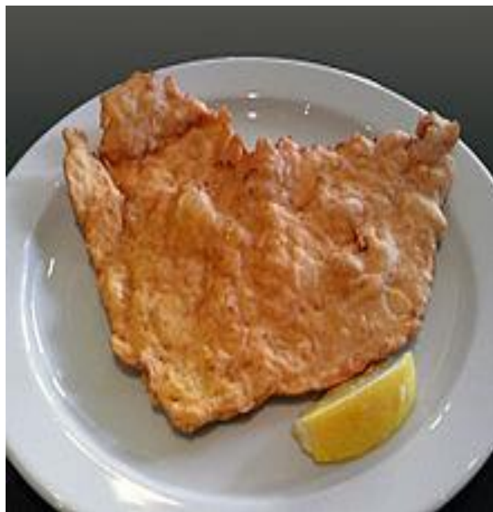
2 Escalope parisienne