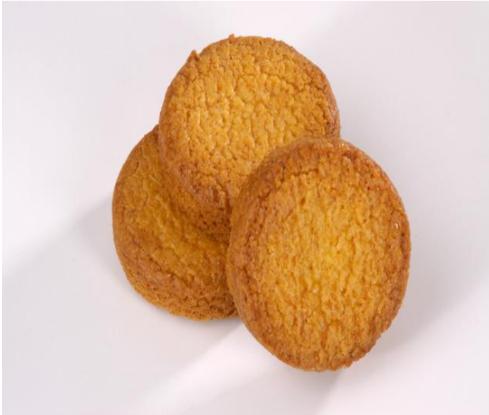
11 palets bretons