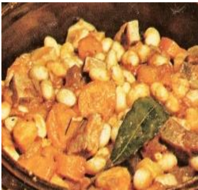
1 Mojettes du marais