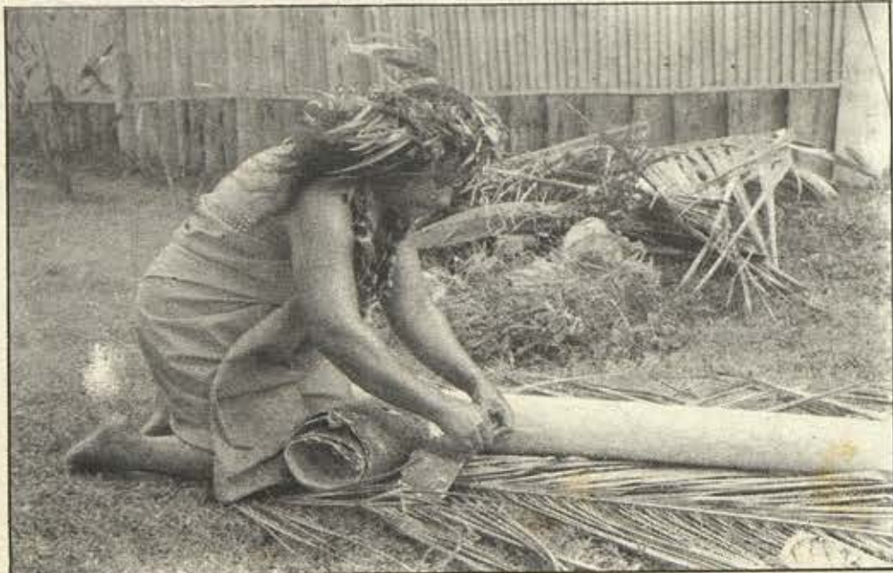
Fabrication du tapa.

Ia hiòhia te auraa o teie nā parau e piti, eita roa e tano ia faatea-ê-hia to rāua faaòhiparaa i roto i te oraraa faaroo o te hoê nūnaa.