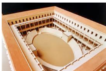
maquette du Ludus Magnus

Aujourd'hui, on peut aller observer les ruines de cette caserne à Rome, on y voit encore des morceaux de murs des cellules.