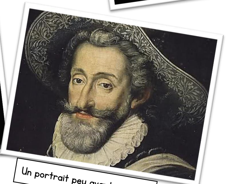
Un portrait peu avant sa mort