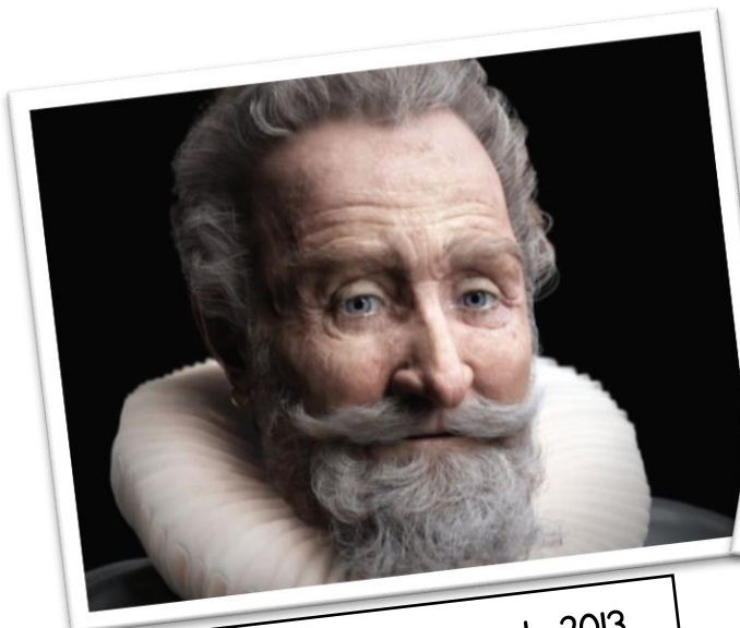
La reconstitution de 2013