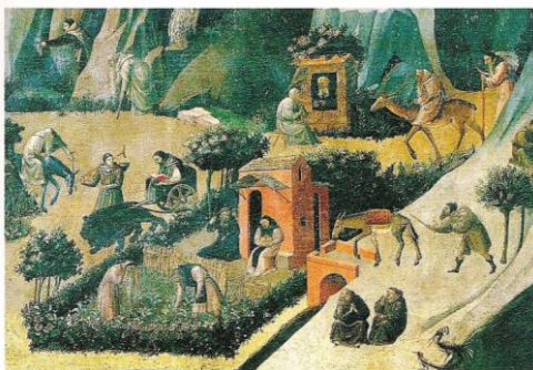
Travail des moines. Détail de la Thèbaïde de Fra-Angelico (1400-1455)

Source : Histoire-géographie CMI (hachette Education)