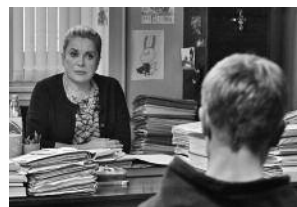
LA TÊTE HAUTE