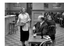
UN PIGEON PERCHÉ SUR UNE BRANCHE PHILOSOPHAIT SUR L'EXISTENCE

comme une étonnante exposition, en méditant et en prenant son temps.