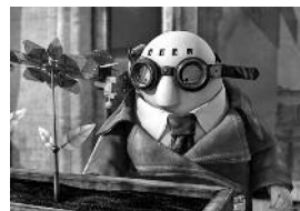
LES FANTASTIQUES LIVRES VOLANTS DE M. MORRIS LESSMORE

Un programme de cinq courts-métrages sur le thème de l'imaginaire et de l'imagination : "M. Hublot" de Laurent Witz et Alexandre Espigares (Oscar 2014 du meilleur court-