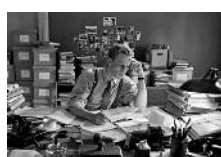
LE LABYRINTHE DU SILENCE

Allemagne, 1958. Un jeune procureur découvre des pièces essentielles permettant l'ouverture d'un procès contre d'anciens SS ayant