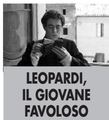
LEOPARDI, IL GIOVANE FAVOLOSO