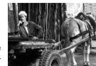
LES MILLE ET UN CAIRE

Une invitation à déambuler dans le Caire en compagnie de la musique du trio Afro Garage et de la caméra magique de Pio Corradi. Une immersion dans les rues, une expérience fascinante - mélange d'atirance et de répulsion pour la plus grande ville d'Afrique, mégalopole bruyante, puante, polluée, surpeuplée, étouffante, envahissante et tellement attachante. Sensations et sentiments, impressions et souvenirs participent à cette évocation poétique et musicale. Dans le labyrinthe cairote, la main est partout à l'œuvre, elle fabrique, bricole, répare. On vend, on bonimente, on va à la mosquée, on ruse pour traverser les flots de voitures qui envahissent les rues. Les scènes cocasses se succèdent dans le plus grand naturel. On a toujours le temps pour boire le thé, fumer une chicha et refaire le monde. On goûte le temps qui passe, on partage un unique art de vivre.