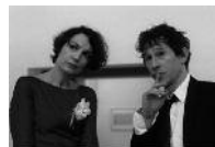
LE DOS ROUGE