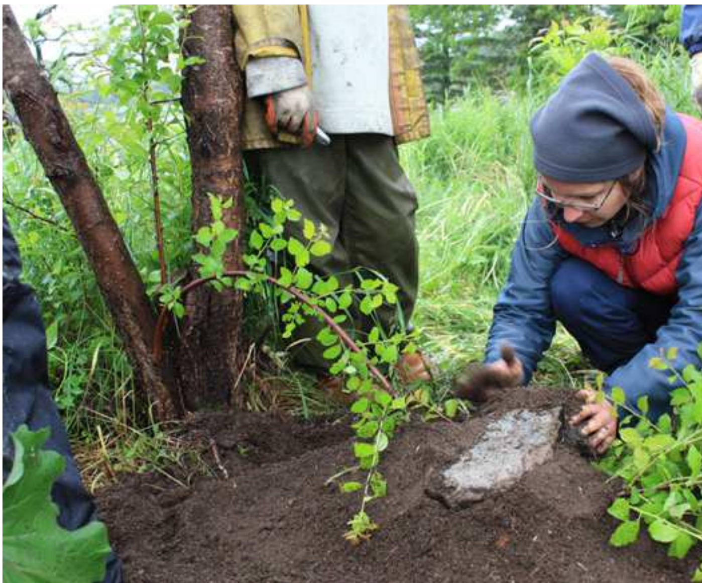
Le marcottage par couchage

Parmi les techniques de multiplication des plantes, le marcottage fait partie de celles qui sont faciles, gratuites et amusantes ! Il se pratique surtout au printemps jusqu'en automne et avec des plantes ligneuses et semi-ligneuses : l'opération de marcottage consiste à faire émettre des racines à un rameau avant de le détacher de la plante mère. Le nouveau pied est parfaitement identique au pied mère, il ne subit pas de dégénérescence. Plusieurs techniques de marcottage existent selon les types de végétaux.