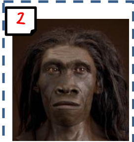
Homo erectus en Europe