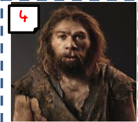
Homme de Neandertal