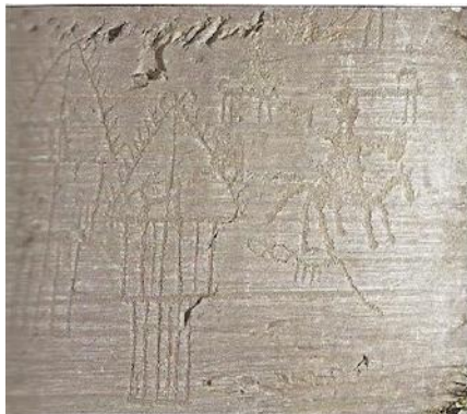
Rocher gravé de scènes de la vie quotidienne dans un village.

Il s'agit d'une gravure datant de l'époque préhistorique. On y voit un village (maisons) et un homme qui semble assis sur un âne.