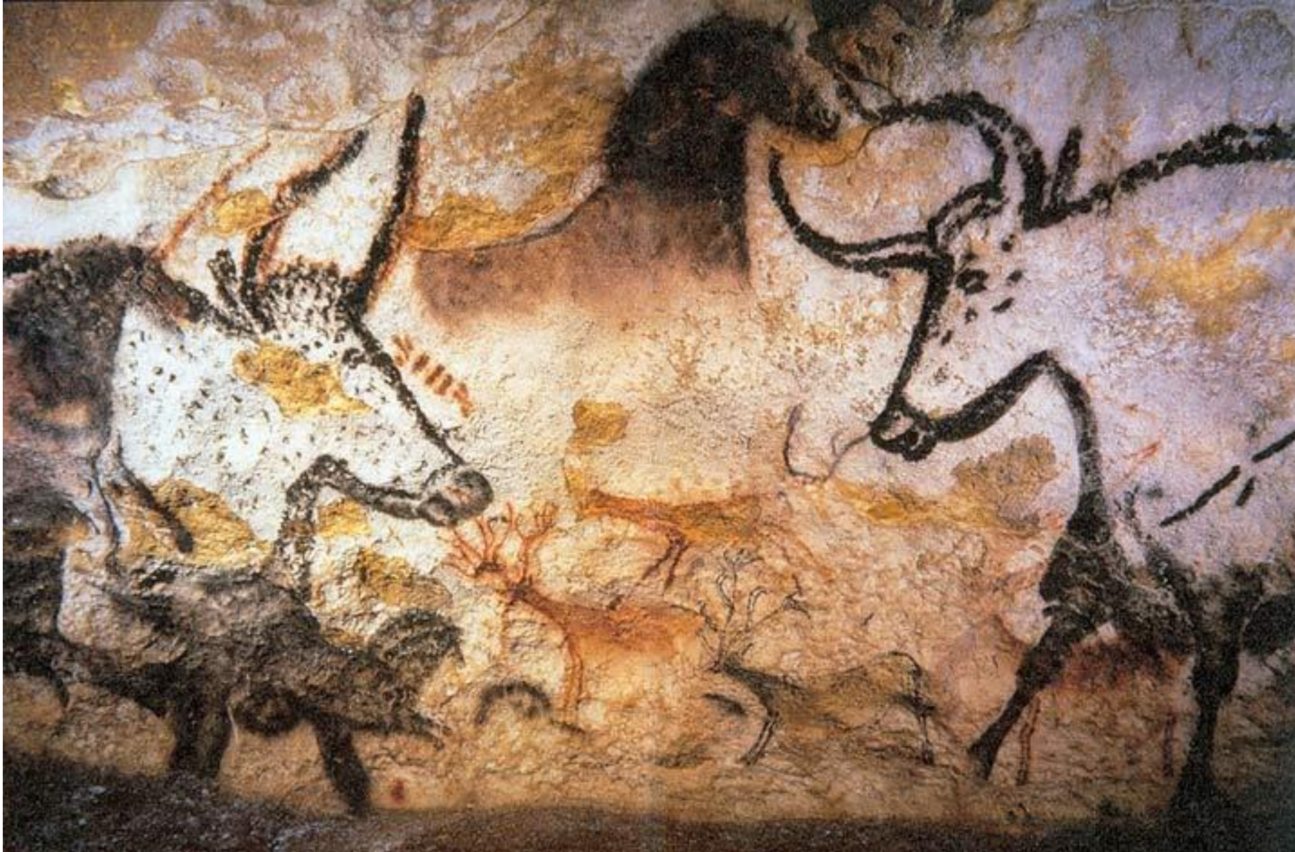
Peintures rupestres dans la grotte de Lascaux Fresque représentant des aurochs (animaux préhistoriques)