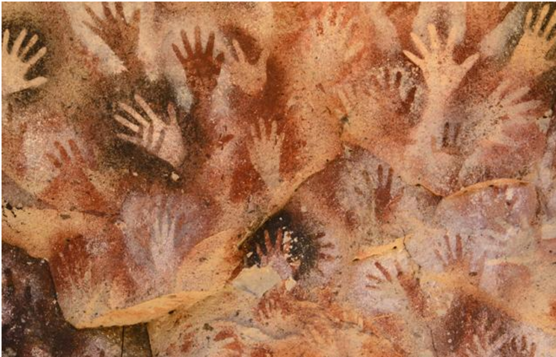
Peintures rupestres dans une grotte en Patagonie argentine. Fresque de mains négatives (avec projection de couleur) et positives (par principe d'imprimerie, de tampon)