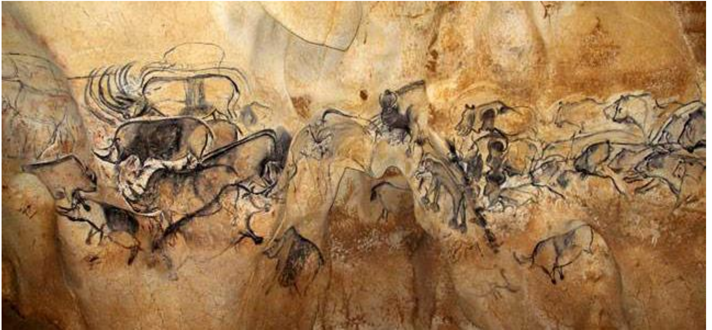
Peintures rupestres dans la grotte Chauvet. Grande fresque de la salle du fond. Ces animaux ont été réalisés par raclage de la paroi.