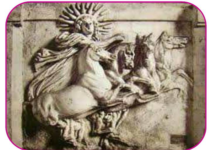
Hélios et ses quatre chevaux