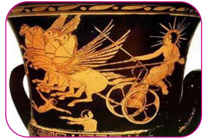
Hélios, dieu Titan du soleil