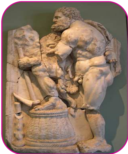
Panneau de marbre représentant Héraclès nettoyant les écuries d'Augias

Hélios : fils du Titan Hypérion et de sa sœur Théia .Personnification du Soleil, Hélios est progressivement assimilé à Apollon, dieu de la musique et des arts. Dans la mythologie romaine, il correspond à Sol.