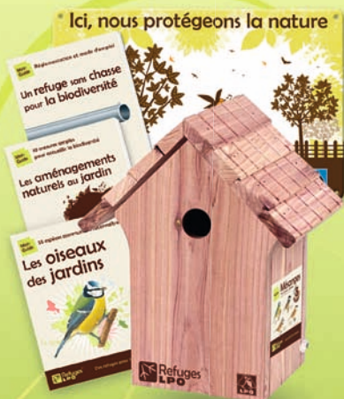
Coffret Refuge jardin