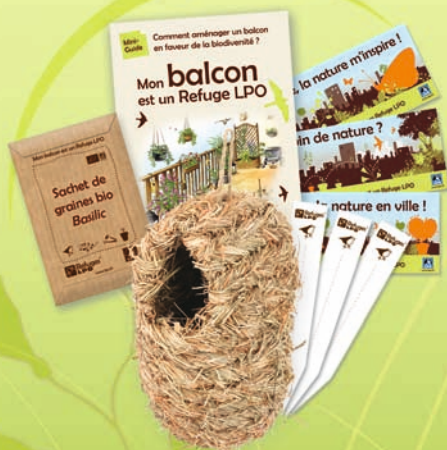
Coffret Refuge balcon

Gagnez du temps : inscrivez-vous en ligne sur http://monespace.lpo.fr