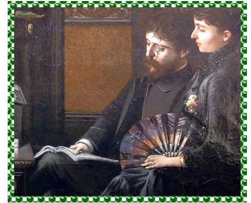
Alphonse Daudet dans son cabinet de travail avec son épouse (détail)