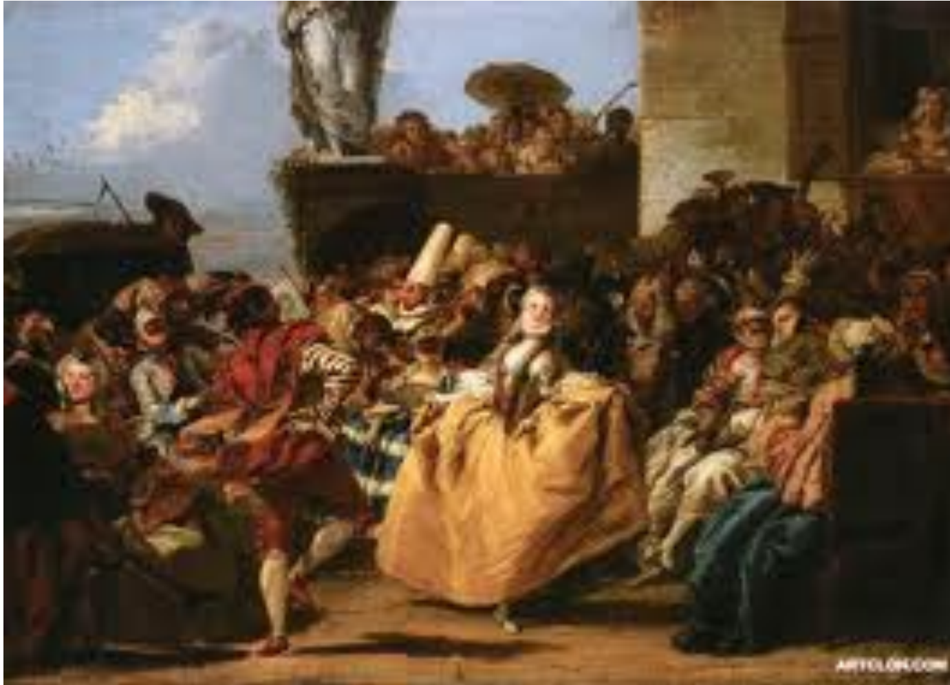
Giandomenico Tiepolo, Il Minuetto , 1754

Leggi l'alfabeto e di' quali divertimenti illustra questo quadro: