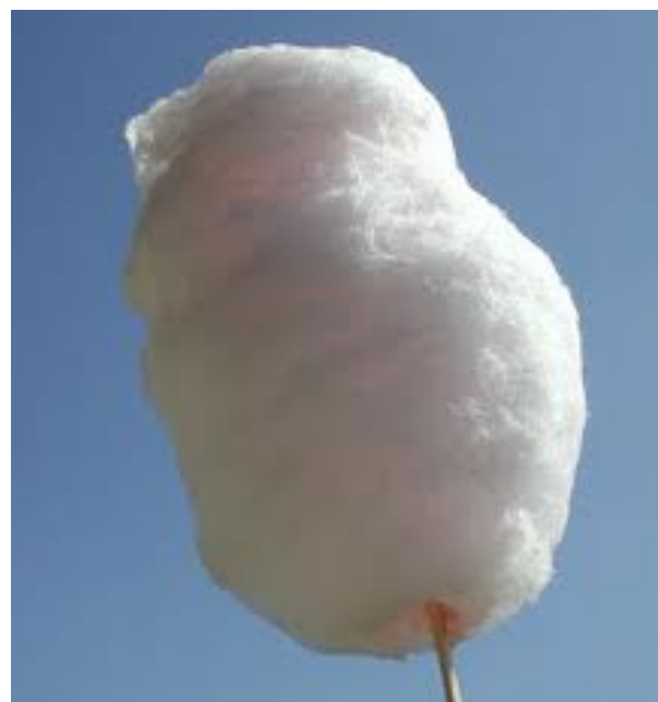
Lo zucchero filato