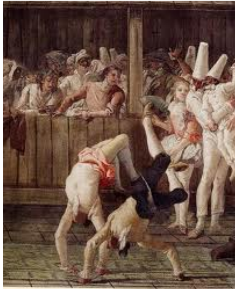
Giandomenico Tiepolo, Pulcinella e i saltimbanchi , 1791-1793

Leggi l'alfabeto e ritrova nell'immagine uno dei personaggi citati: