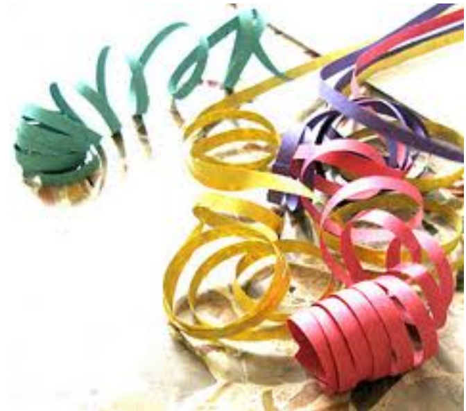
Le stelle filanti