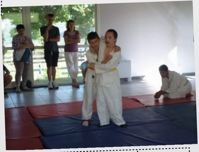
Félicitations aux judokas qui nous ont présenté leur activité et reçu une nouvelle ceinture récompensant les efforts fournis tout au long de l'année