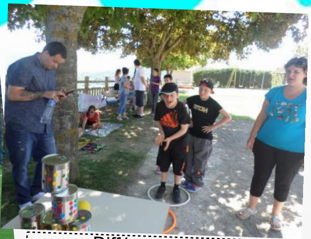
Différents ateliers étaient proposés dont le chamboule-tout qui a eu un franc succès.