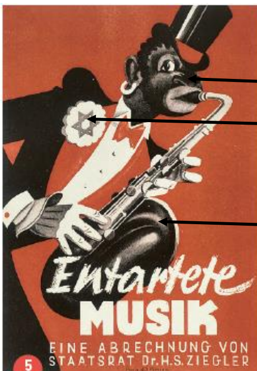
Brochure de l'exposition « La musique dégénérée », Düsseldorf, 1938

En 1937, Hitler inaugure une exposition consacrée à l'« Art dégénéré ». Les œuvres exposées étaient rejetées par le régime nazi pour leur modernité (sculptures ou peintures représentant par exemple des visages ou des corps déformés) mais aussi et surtout parce que leurs auteurs étaient juifs, opposants au régime ou encore considérés comme fous.