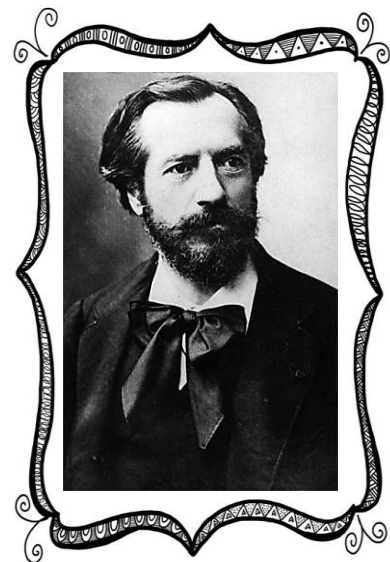
Auguste Bartholdi et sa signature

Cette statue représente la liberté éclairant le monde.