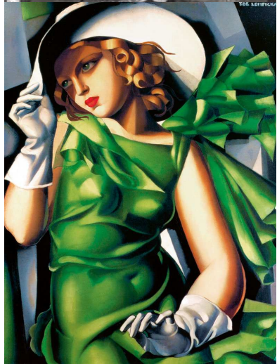
Jeune fille au vent