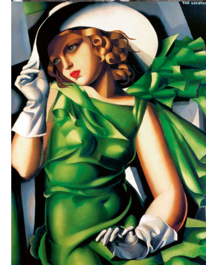
Jeune fille au vent