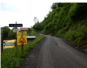
Route des Boléros

Le classement de notre commune en état de catastrophe naturelle intervenu le 9 mars a permis aux particuliers concernés de bénéficier de meilleures conditions d'indemnisation auprès de leurs compagnies d'assurance. Pour la commune, dont les dégâts sur la voirie se chiffrent à près d'un million d'euros (soit dix années de notre budget en investissement voirie), nous dépendons des subventions que vont attribuer l'Etat, la Région et le Département, qui ont tous annoncé leur volonté de venir en aide aux communes sinistrées. Mais à ce jour, nous sommes toujours dans l'attente de leurs notifications. Seule la Région nous a indiqué un chiffre qui devrait être confirmé dans le courant de ce mois.