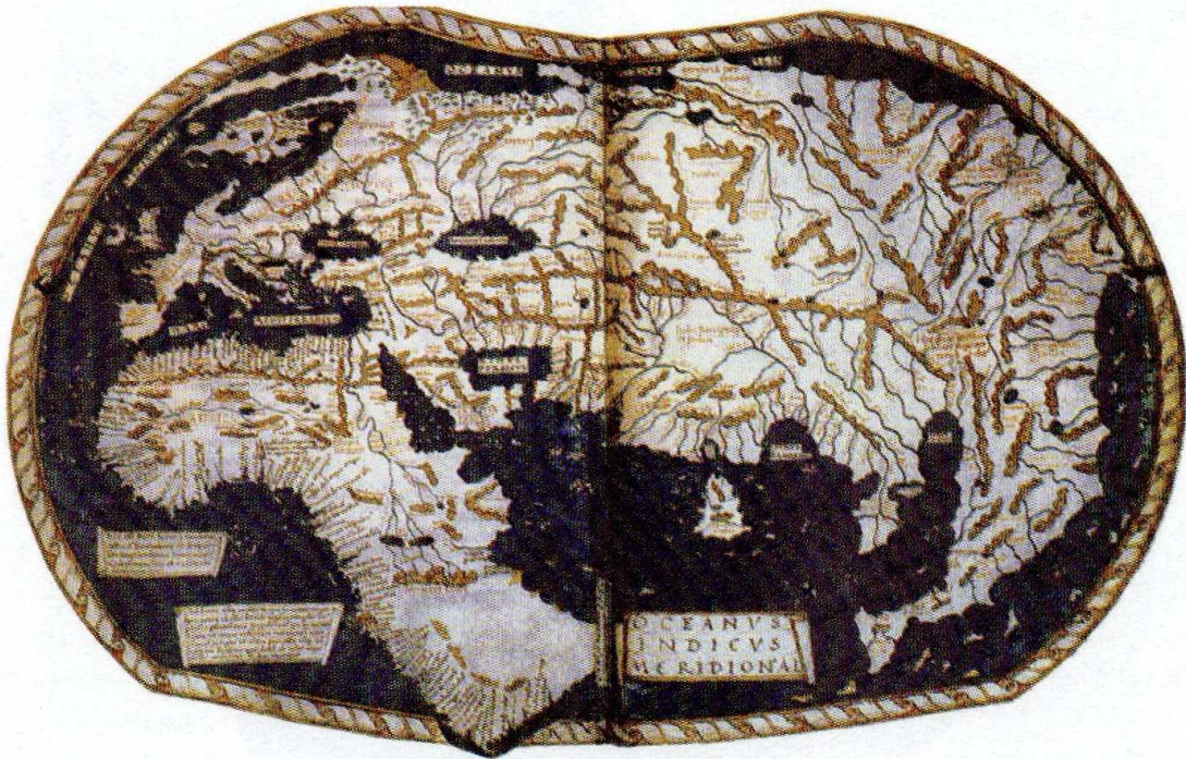
Carte de 1486 de Ptolémée